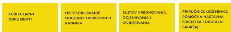
Slika 1. Elementi Cjelovite kurikularne reforme

Cjelovita kurikularna reforma osmišljena je sveobuhvatno, odnosi se na sve razine i vrste odgoja i obrazovanja i usmjerena je na sljedeća četiri jednakovrijedna elementa (Slika 1.):